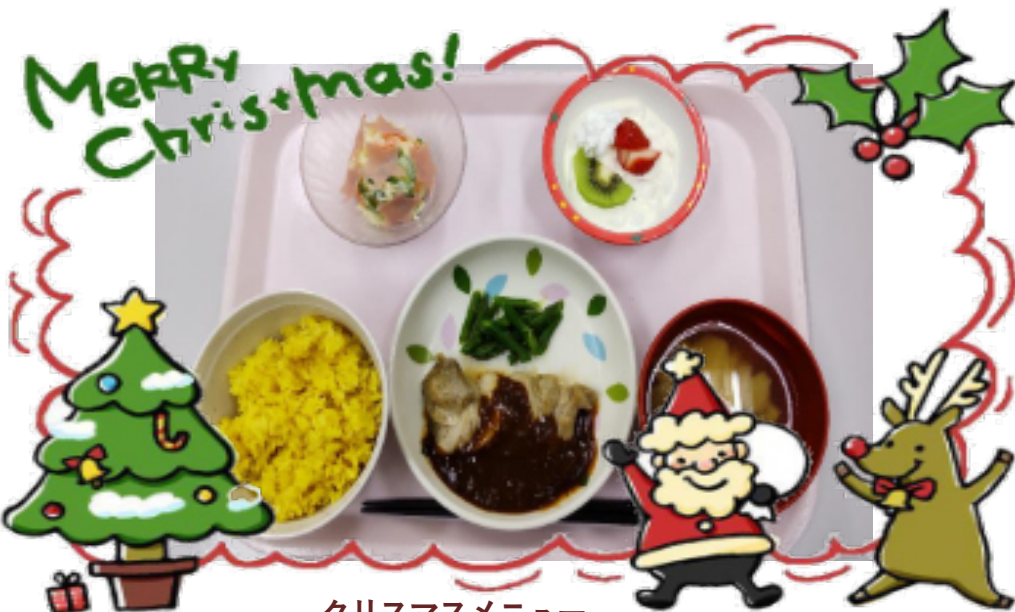
クリスマスメニュー